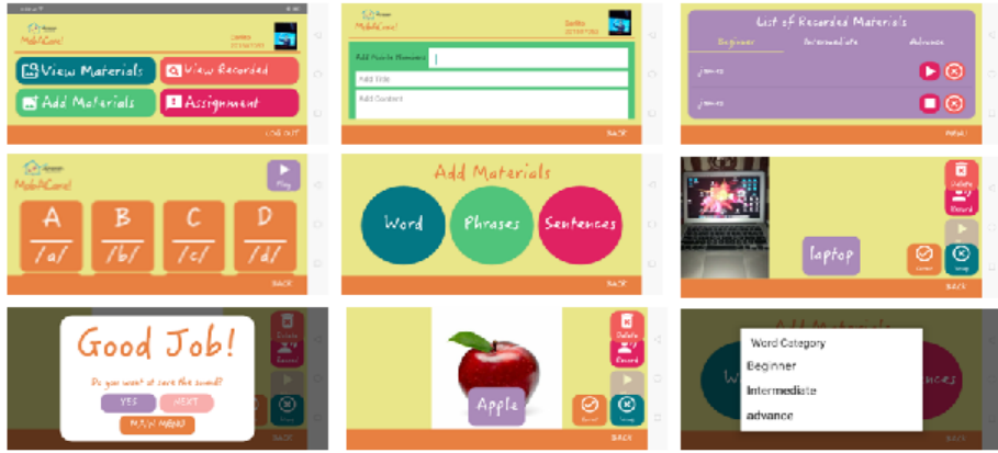
Fig. 1. Interface design of the Mobile Application

٢- تطبيق يودل لتقليل اضطرابات النطق و الكلام (Wemogee AI):- أعلنت شركة "سامسونج" الكورية عن توفيره تطبيقا جديدا، موجها للذين يعانون من مشاكل في النطق؛ و هو تطبيق (Wemogee AI) وحيث سيحوّل هذا التطبيق النصوص المنطوقة إلى رموز تعبيرية والعكس، من خلال مكتبة ضخمة بها قاعدة بيانات عملاقة تحتوي على الكثير من الكلمات و الجمل المستخدمة. يخدم هذا التطبيق الفئات التي تعاني من اضطرابات النطق و الكلام و يتميز بسهولة استخدامه و يدم التطبيق حاليا لغتين فقط الإنجليزية و الإيطالية. شكل (٢) يوضح طريقة استخدام التطبيق على الهاتف المحمول. an assistive mobile application for speech therapy.