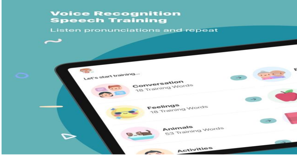
شكل (٣) تطبيق Huni المخصص للأطفال للتدريب على نطق الكلام بطريقة صحيحة

التطبيق مع الأطفال الذين يعانون من تأخر في الكلام أو الأطفال الذين يعانون من التلعثم و عسر القراءة. انظر شكل (٣)