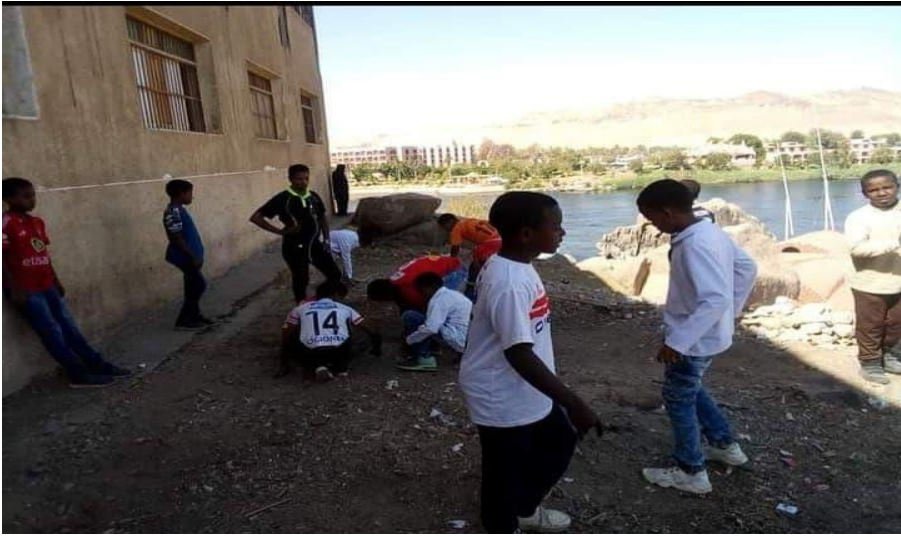
صورة (٤). ممارسة الأنشطة لأطفال النوبة