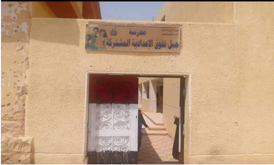
صورة (١). إحدى مدارس النوبة