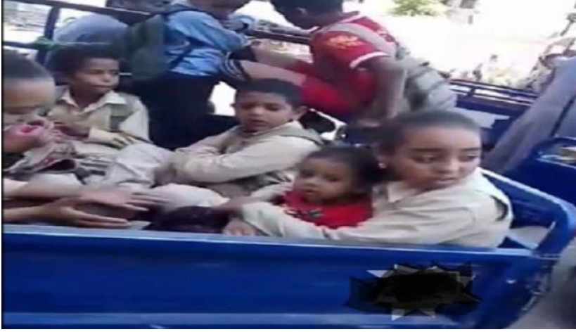
صورة (٧). التكديس في وسائل غير ملائمة لنقل الأطفال لمدارس النوبة