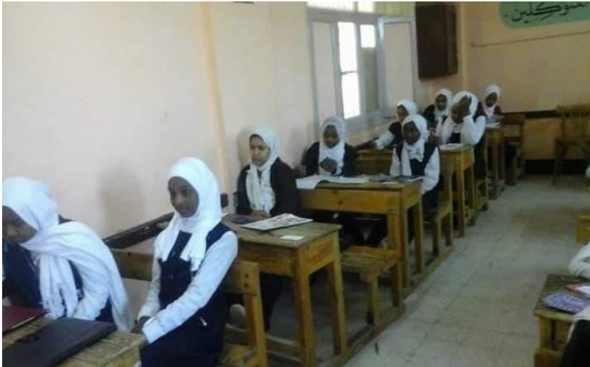
صورة (٢). أحد الفصول بمدارس النوبة