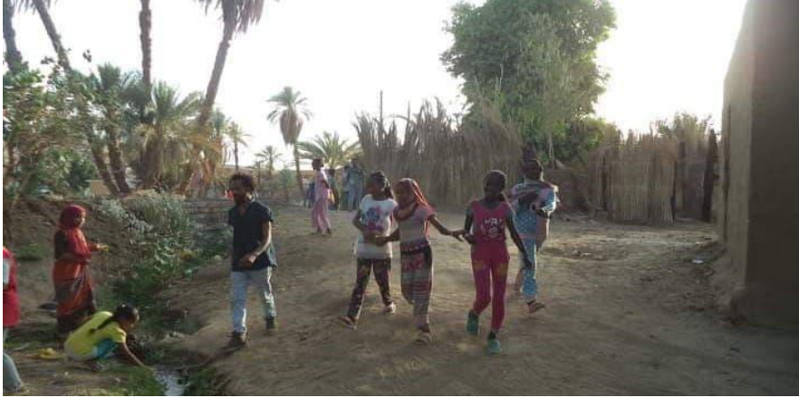
صورة (٥). ألعاب أطفال النوبة خارج المراكز أو النوادي