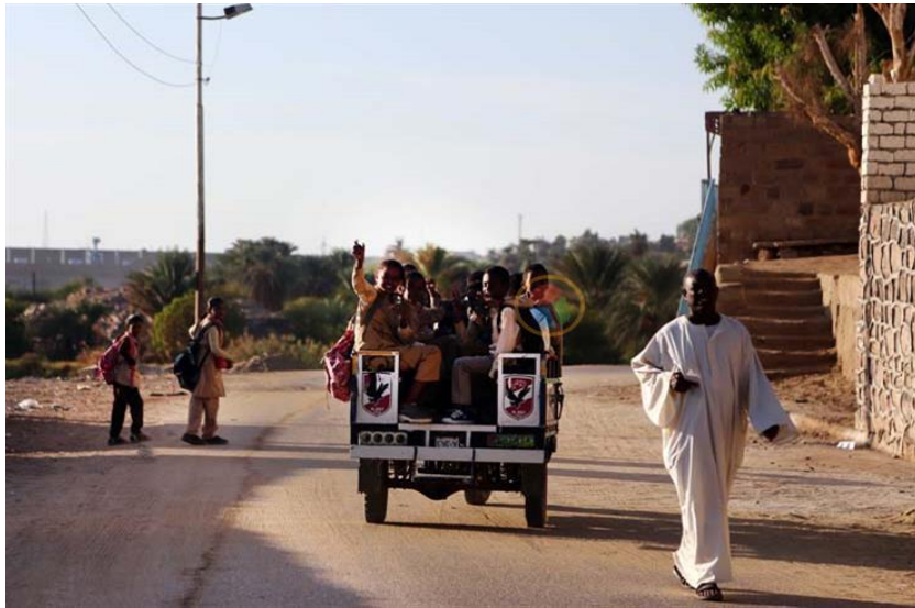
صورة (٦). وسائل المواصلات في النوبة