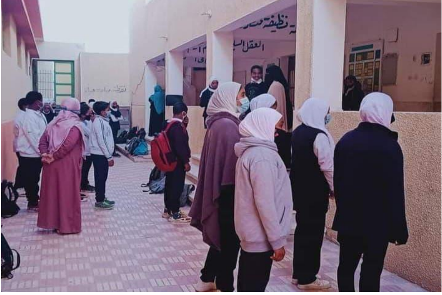
صورة (٣). صورة من داخل إحدى مدارس النوبة